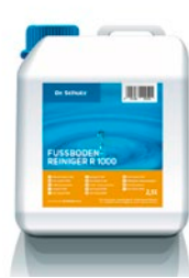
Fußbodenreiniger R 1000