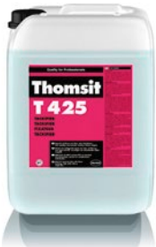
T 425 Tackifier