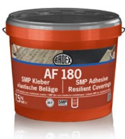
Ardex AF 180